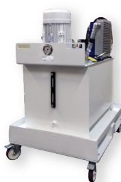
Centrale hydraulique mobile