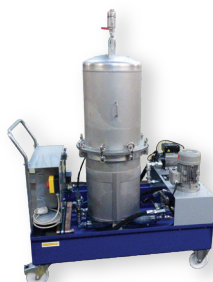
Dépollution verniss grande capacité