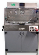
Banc d'essai Pression