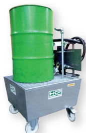
Transfert de fluide avec filtration